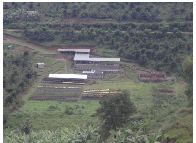
Coffee washing station near Karongi town