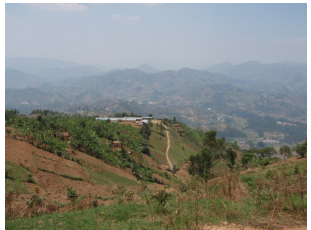
Typical scenery in Rwanda during Mt. Kabuye hiking