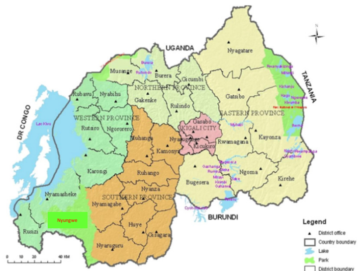
Map of Rwanda / ルワンダの地図

( http://www.rwandapedia.rw/page/rwanda-country-profile )