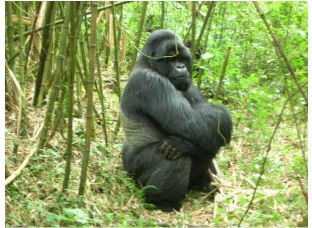
Mountain gorilla (boss of Hirwa ('lucky') group)

The last destination is Habiryaimana Presidential Palace Museum in the capital Kigali. Habiryaimana was the head of state in Rwanda in 1994 and the genocide began when his jet plane was shot down and he got killed. Surprisingly, the crashed plane fell down very next to his presidential palace, so when you visit the museum, you can see the palace inside and some real remnants of the jet plane scattered next to the palace. In the palace, the guide will explain you very interesting facilities such as a hidden escape and a secret altar of traditional religion, which is rather a taboo currently (ref: Monthly Rwanda vol.38). I like this museum the best compared to other museums because of its uniqueness.