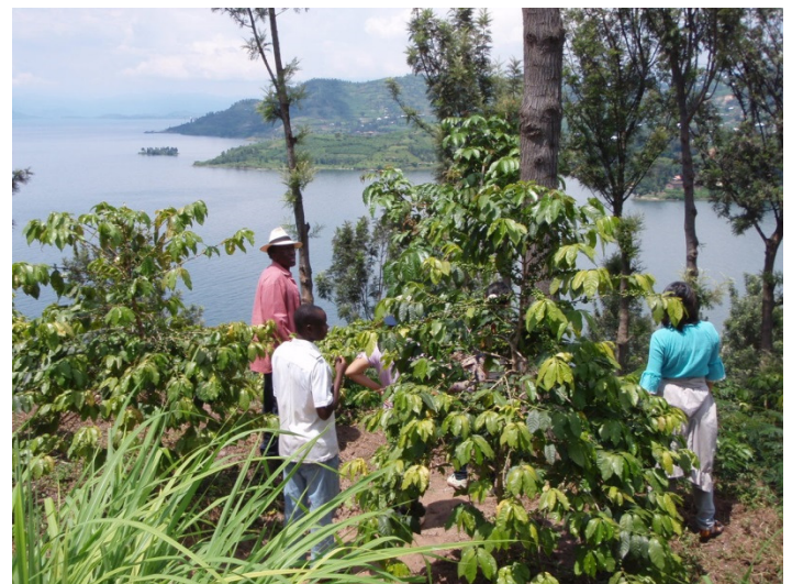
Organic coffee plantation near Rubavu town