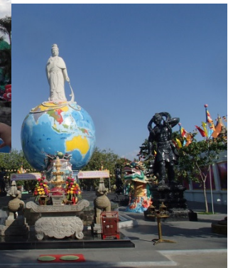
Many statues at Suoi Tien Buddhist Them Park were not majestic but rather comical to me

スイティエン仏教テーマパークにあった像の多くは、荘厳というよりはむしろコミカルな感じでした