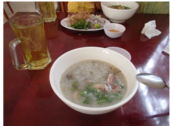
Many Vietnamese foods are not oily and healthy ヴェトナム料理の多くは脂っこくなく健康的です

ところで、滞在中の最低気温は、例年より摂氏10度くらいは温暖でした。気候変動はアフリカとアジア、そして地球規模で本当に生じているようです。