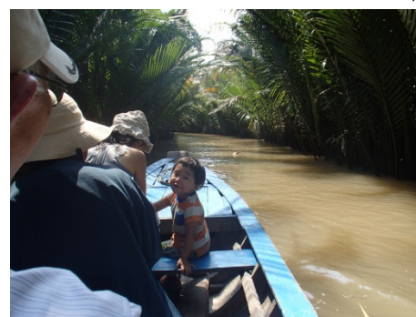
Rowboat riding at Mekong Delta