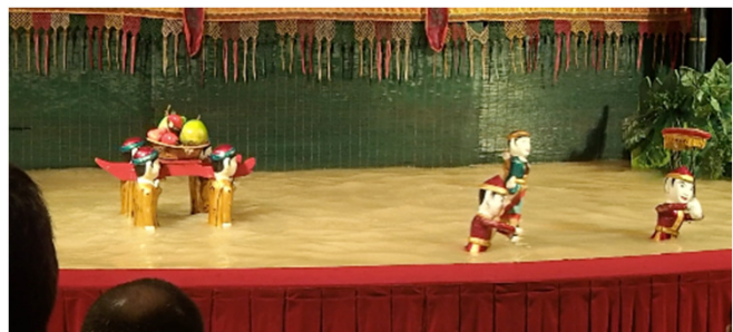
Water puppet show / 水上人形劇

スイティエン仏教テーマパークにあった像の多くは、荘厳というよりはむしろコミカルな感じでした