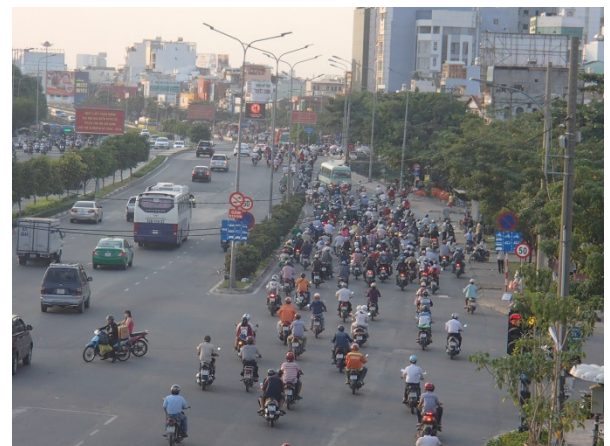
A huge number of commuting motorbikes