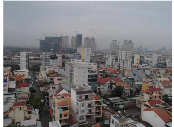
High-rise building construction near the hotel we stayed at

By the way, the lowest temperature during our stay was warmer for around ten degree Celsius than usual one. The climate change seems to be really happening both in Africa and Asia, and at the global scale.