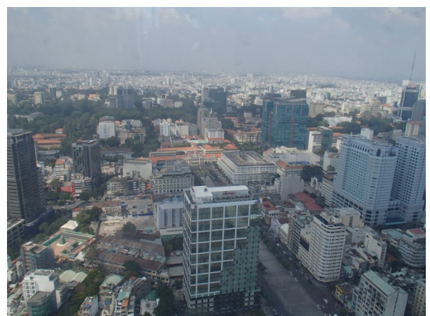
HCMC downtown from 49F observatory