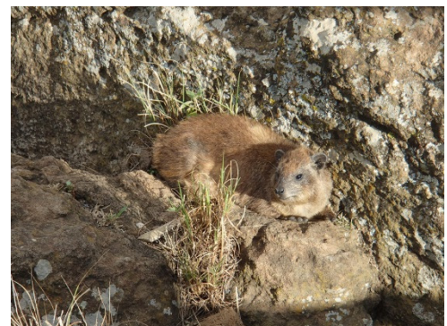
Hyrax: somehow taxonomically it is close to an elephant / ハイラックス: 分類学上何故か象に近いそうです