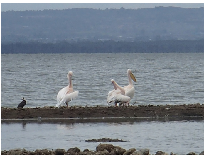
Pelicans? (at Nakuru Lake shore) / ペリカン? (ナクルの湖畔で)

Rhinos: they have bad eyes and realized our car only after getting very close (they seemed to be only concentrated on eating grass)