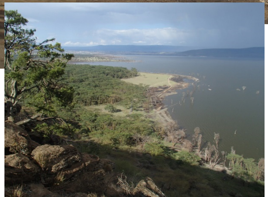
Lake Nakuru / ナクル湖