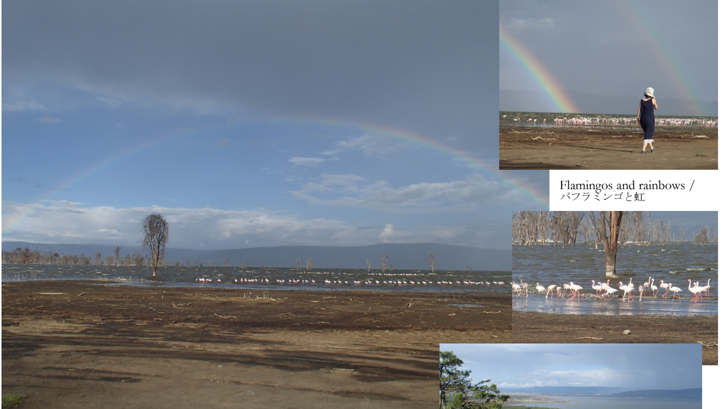
Flamingos and rainbows / バフラミンゴと虹