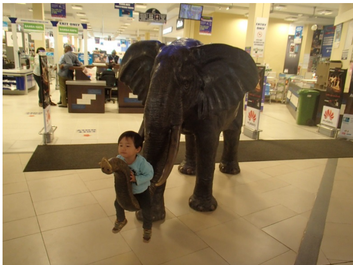
At an entrance of Nakumatt supermarket, which is the biggest supermarket chain store in Kenya / ケニア最大のスーパーであるナクマトの入口で

Nevertheless, we could see some flamingos and other animals such as giraffes, different types of deer, zebras, hyraxes and rhinos. Specifically, it was an amazing experience to see rhinos just a few meters away. Although our two-year-old son Shota says that he only remembers zebras to have seen after one week of the trip, we hope he has obtained a good sense of interaction with real wild nature at least subconsciously.