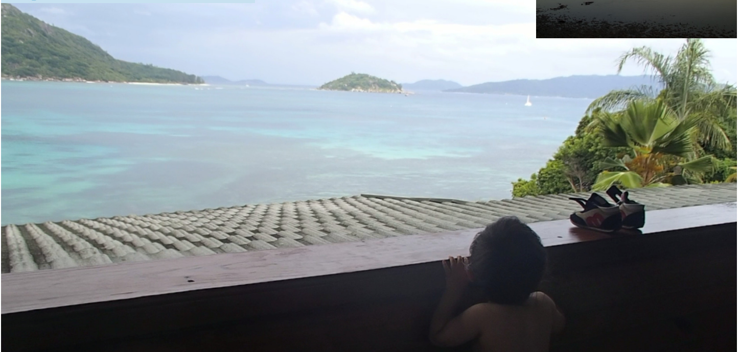
Ocean view from the room we stayed 滞在した部屋からの海の眺め