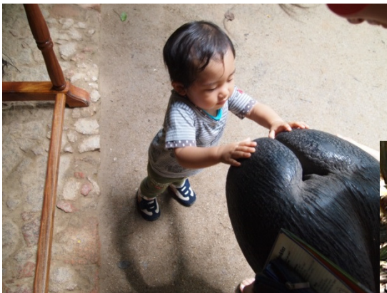
The largest coconut seed in the world at the Vallee de Mai world heritage national park