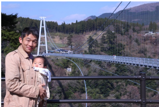
The highest (173m) and the longest (390m) suspension bridge in Japan for pedestrians 日本一の高さ(173m)と長さ(390m)の歩行者用吊り橋

こちらに戻って来て、3月中旬に申請したルワンダ住宅局での契約更新手続きがまだ完了していませんと知りました。本来はショックを感じるべきことなのでしょうが、アフリカに何年も住んでこういう驚きには慣れてしまいました。幸い、他にやらなければいけないことがいろいろとあるので、それらをこなしつつ、契約更新できましたという良い知らせを素直に待とうと思います。