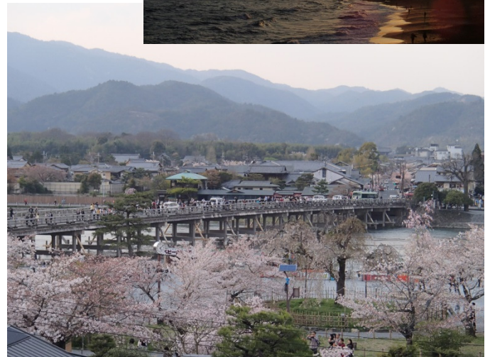
Cherry blossoms in Arashiyama, Kyoto 京都嵐山の桜