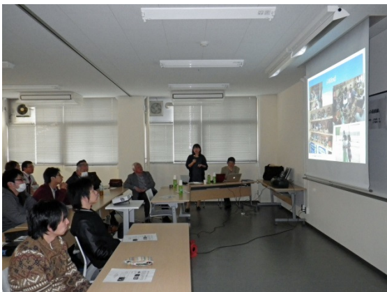
Presentation on Rwanda at Fukuoka University 福岡大学でのルワンダについての講演