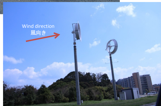
High efficient wind turbine developed by Kyushu University 九州大学で開発された高効率風車

We made presentations on Rwanda at places with red dots 赤い点の場所でルワンダについて講演をしました